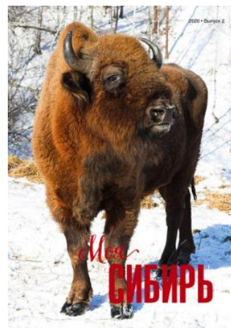
Фото обложки выпуска №2