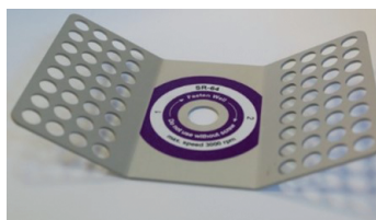
8 стрипов по 8×0,2 мл

FV2800 Центрифуга-вортекс, 2800 об/мин, 500g, diaGene FV2800, Диаэм, Россия 26 800,=